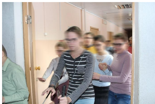
Рис. 6. Процесс движения детей с недостатками зрения через дверной проём

Для детей, передвигающихся на креслах-колясках, такой вид пути также является затруднительным. Это связано с тем, что ширина коляски (0,7-0,9 м) сопоставима с шириной проёма (0,8-0,9 м), а также с наличием порогов (даже нормативной величины – не более 0,014 м [7]), что вызывает снижение скорости и приостановку движения (отмечалось в 25 % случаев).