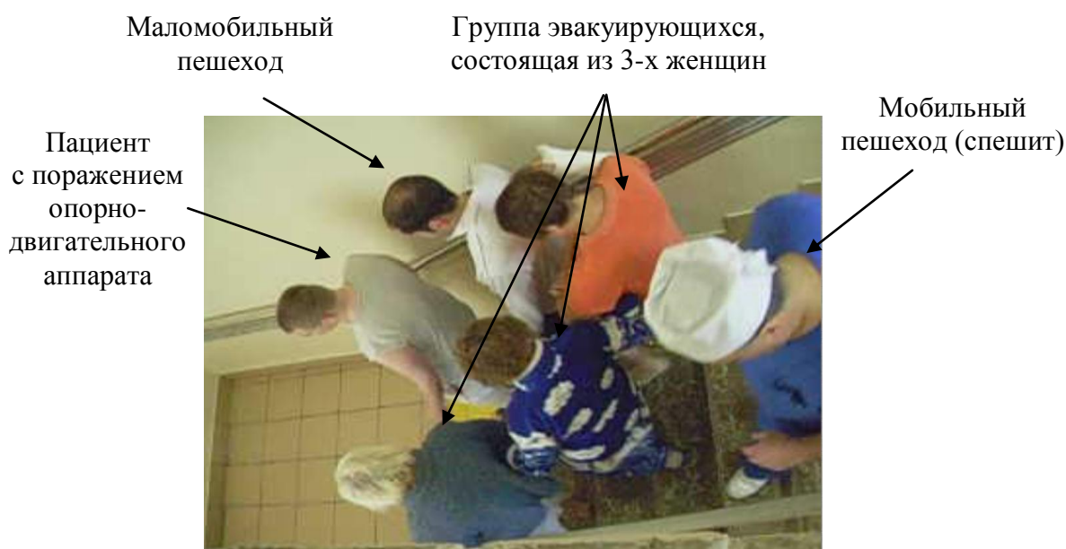
Рис. 2. Образование характерного кластера: пациент с поражением опорно-двигательного аппарата (передвигающийся без дополнительных опор) затрудняет движение трем женщинам, идущим в группе и взявшимися за руки. Сформировавшаяся группа лишает возможности пешехода (врача), идущего с более высокой скоростью их обогнать. Общая скорость движения группы составила 18 м/мин.

Следует также подчеркнуть, что в ряде случаев, снижение количества пешеходов, решающих обгонять людей, передвигающихся с более низкой скоростью, объяснялось большими динамическими габаритами людей, использующих при движении кресла-коляски и дополнительные опоры, и, как следствие, опасение как помешать движению, так и получить травму. Вторым важным фактором, обуславливающим общую низкую скорость потока, является эвакуация в составе групп, в которых двигались 55 % процентов пешеходов (рис. 2).