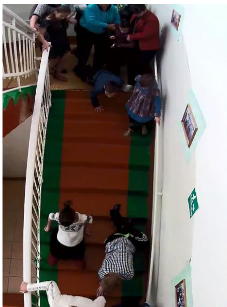
Рис. 5. Дети, передвигающиеся ползком по лестнице вниз

Необычную особенность движения удалось установить для детей с поражением опорно-двигательного аппарата. Было выявлено, что около 23 % детей, использующих для движения кресла-коляски, приближаясь к лестнице, оставляют кресло и дальше начинают двигаться ползком по ступеням лестницы. Средняя скорость в таком случае составляет 28 м/мин. (рис. 5).