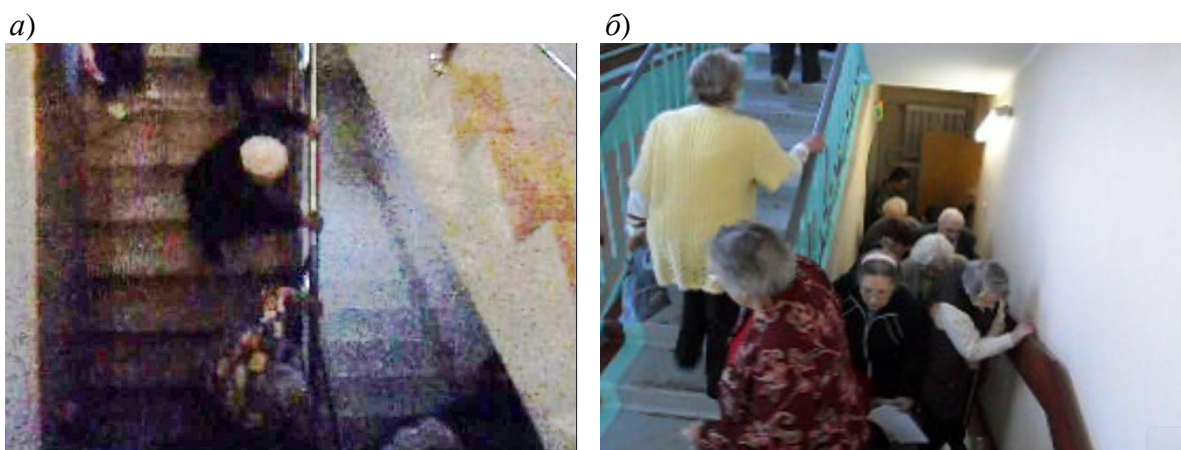
Рис. 4. Движение пожилых (немошных) людей по лестнице с опиранием двумя руками на перила (со средней скоростью по лестнице вверх – 12 м/мин. и вниз 9 м/мин.) и уменьшение интенсивности движения людского потока с 39 до 20 чел./м·мин.

Кроме того, были отмечены следующие особенности движения пешеходов с поражением опорно-двигательного аппарата: это остановка движения, отмеченная в 9,5 % случаев, и пониженная устойчивость пешеходов.