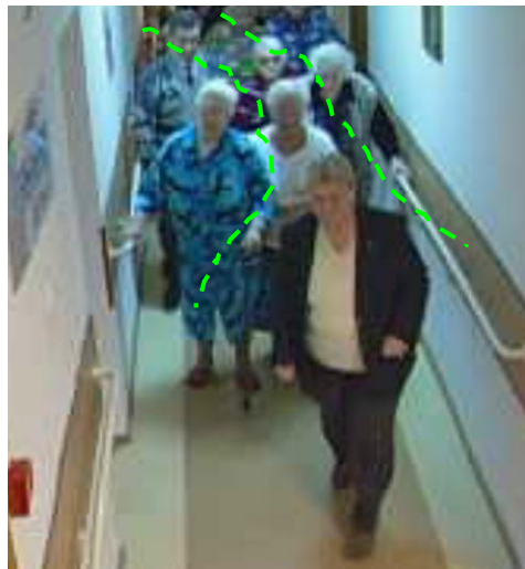
Рис. 3. Две женщины, передвигающиеся с помощью дополнительных опор и опирающиеся на перила, задерживают движение людей в потоке. Ширина условного пути движения между пожилыми пешеходами составляет 0,4 м, скорость их движения V_{\text{ср}} = 16 \text{ м/мин} .

Осуществление контактного обгона по участку с шириной, обусловленной расстоянием между пожилыми женщинами